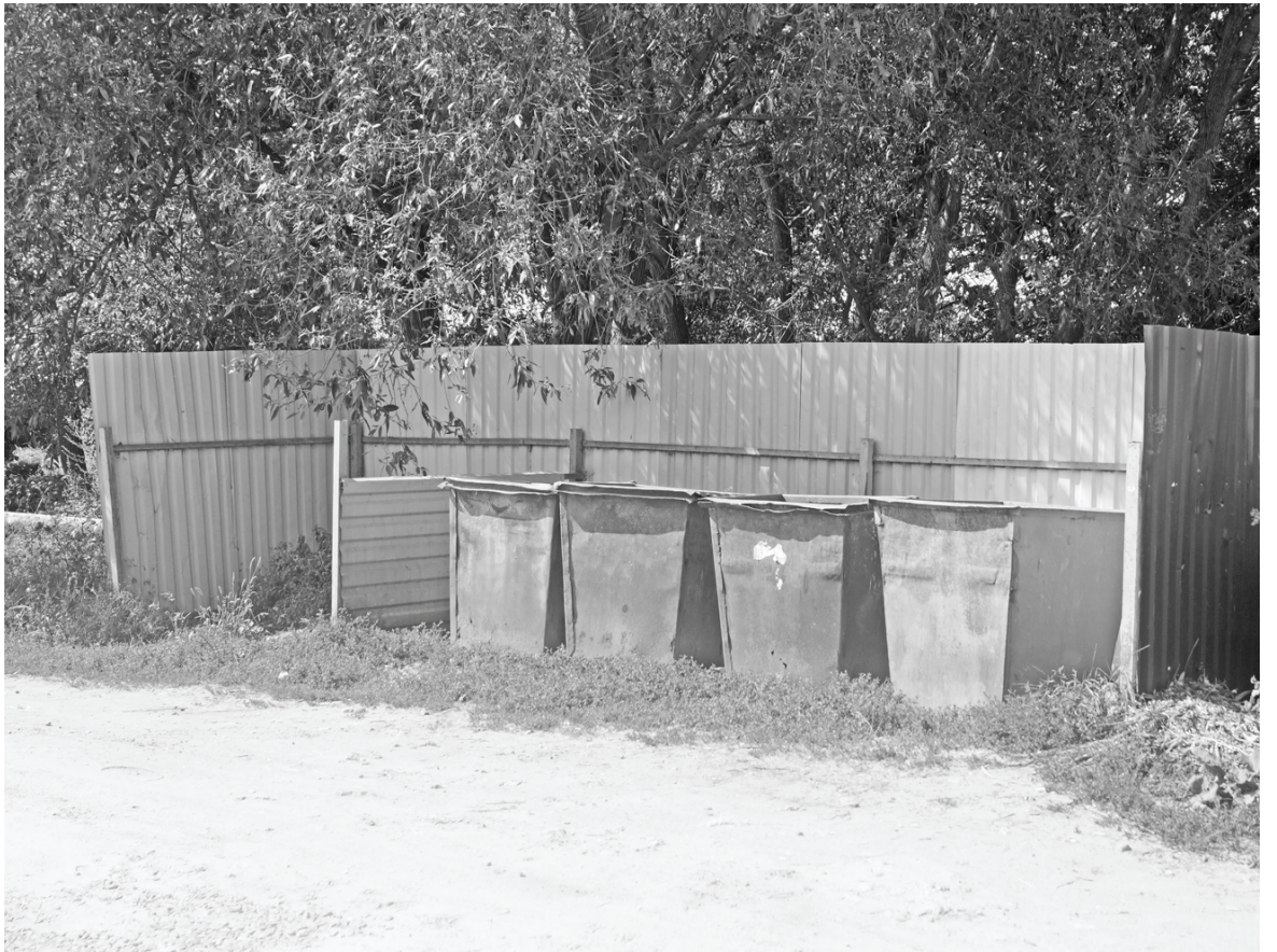
Качеством услуги по вывозу твердых коммунальных отходов с контейнерных площадок, установленных в районном центре, жители многоквартирных домов довольны. С 1 июля с приходом новой компании на площадках стало чисто, график вывоза соблюдается строго.

Далее на совещании обсуждались вопросы уборки зерновых и заготовки кормов в хозяйствах района, меры по возвращению в оборот необрабатываемых земель сельхозназначения, тема подготовки к отопительному сезону: капитальный ремонт водопровода практически завершён на станции Думиничи, в ближайшее время начнется в селе Чернышено.